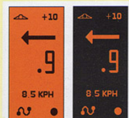
Pantalla diurna / nocturna